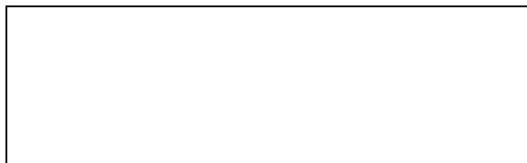
Схема границ эксплуатационной ответственности сторон

Прочие сведения по установлению границ раздела эксплуатационной ответственности сторон _____